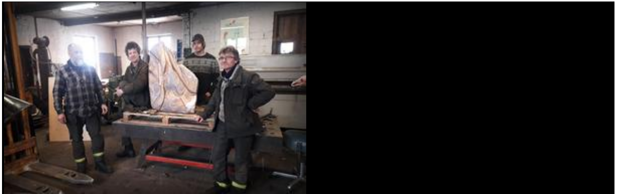
Hantverkarna på Navab samlade runt bronsreliefen.

– Utan smederna på Navab här i Nordingrå hade det inte gått. De har gjort ett fantastiskt jobb, det blir ett taktilt tillägg med olika strukturer som man kan känna på. Och målningarna är lackade i Docksta, på Mickes Lack.