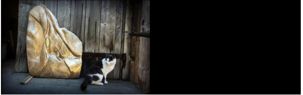
Bronsrelief med katt.